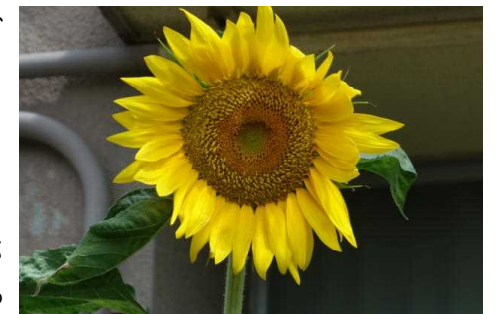
【まっすぐに大きく育っています】

1年生教室前の花壇には、3年生が植えたひまわりが2~3mほどに育っています。大きな花が咲き始めました。子どもたち一人一人も、ひまわりのように大きく成長してほしいと思いました。