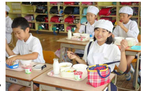
【嬉しそうに食べている子どもたち】

26日、5年生は初めてのお弁当の日でした。家庭科で学習した「ゆでる」調理方法を使って、自分で卵や野菜などをゆでて弁当に入れてきました。牛乳やご飯、味噌汁などは給食です。子どもたちの弁当を見ると、彩りを工夫している弁当や量で勝負している弁当などがありました。朝早くから保護者の皆様にはご協力いただいたことと思います。ありがとうございました。