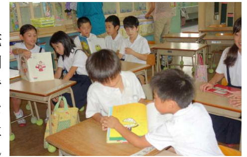
【楽しいペア読書の様子】

30日、朝の活動で、上級生が下級生に本の読み聞かせを行いました。本年度は、いろんな縦割り班ごとの活動を計画していますが、その一つです。楽しそうに読んで聞かせる子ども、緊張しながら読んでいることもなど様々ですが、上級生は一生懸命でした。下級生は、お兄さん、お姉さんの顔と本を見ながら静かに聞いていました。