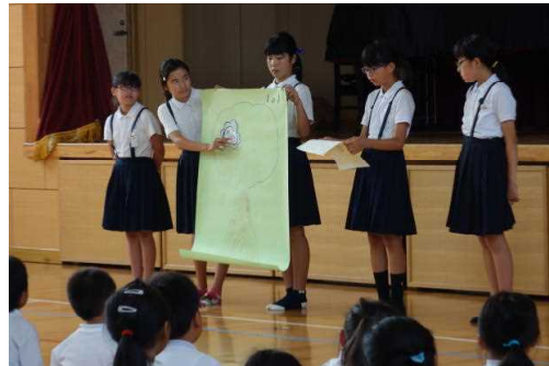
【6年生による説明と呼びかけ】

本年度も、6年生による「あいさつ日本一プロジェクト」の活動が始まりました。年間6回にわけて、6年生を中心としたあいさつ運動を行っています。7月3日の全校朝会にて、6年生の担当が第1回目のあいさつ運動について呼びかけました。特に、本年度は、目指す家庭・地域像として、「あいさつや優しい言葉づかいが響き合う家庭・地域」を掲げ、皆さんと連携した取組をお願いしたいと考えています。学校でもあいさつ等が響き合うような地域となるよう取り組みます。