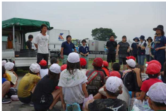
【田植えをする4年生】

27日、4年生は、田植え体験をさせていただきました。毎年、子どもたちのため、10名ほどの皆さんが参加され、苗や水田の準備等ご協力いただいています。本当にありがとうございます。保護者の皆様もご協力ありがとうございました。