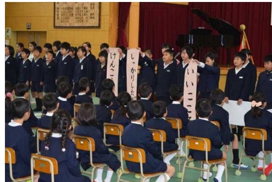
【歓迎式での6年生と1年生】

10日(月)、63名の元気な新1年生が上妻小学校に入学しました。ご来賓の祝福の言葉など、よく聞いて参加をすることができました。6年間で、一人一人の子どもが自分のよさや可能性を發揮できるよう、全教職員で最善を尽くしたいと気持ちを新たにしました。また、6年生は、あいさつ日本一の学校や「けいしの子ども」になることができるよう1年生に呼びかけていました。さすが、本校の最上級生です。