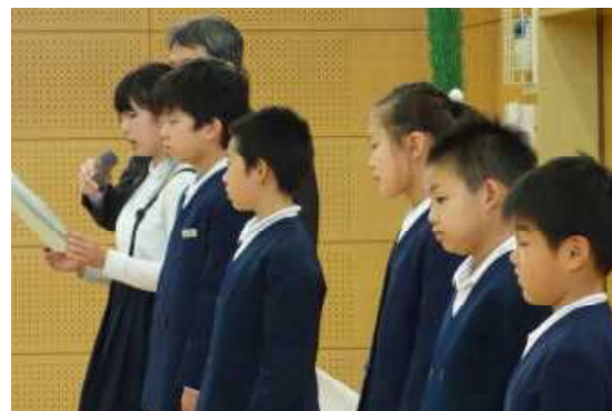
【「けいし」の子どもを目指すめあての発表】

そこで、右記のような目指す児童像と目指す教師像を目標に、保護者や地域の皆様と一体となってがんばります。本年度も、どうぞよろしくお願ひいたします。