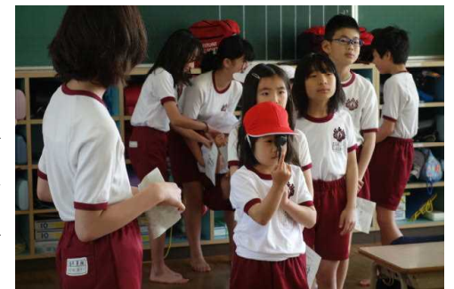
【優しく教える6年生と1年生】

12日は、朝の活動から1校時にかけて、身体測定がありました。身長や体重、視力など各教室などで行われるのですが、1年生は6年生に教えてもらいながら一緒に各教室を回りました。6年生の優しい言葉づかいなどに、成長を感じました。