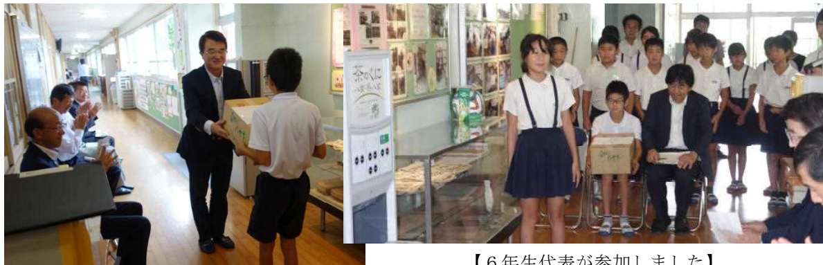
【6年生代表が参加しました】

20日(水) 休み時間に、来賓の皆様をお迎えし、6年生代表12名が参加しました。八女市内の全学校にすでに設置されていましたが、本校が最後になりました。多くの保護者や地域の皆様から、「まだですか?」「私たちも飲めますか?」などご質問を受けていましたが、水道管工事が終了してお披露目式となりました。式の途中、試飲もありましたが、「おいしいねえ。」「たくさん飲みたい。」という6年生の声が聞かれました。来週から子どもたち全員にも飲んでもらいたいと思います。また、保護者や地域の皆様、来校されました際にはぜひご自由に試飲されてください。