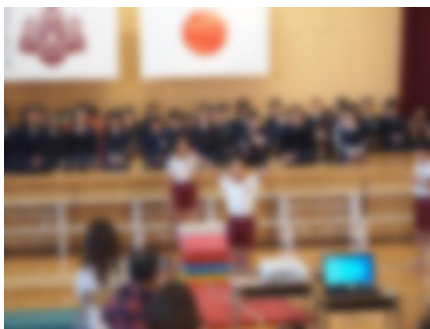
4年生 「絆～人とのつながり」