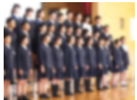
6年生 「平和な世界へ～未来をつくるのは私たち～」