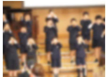
3年生 「三年生的一天」