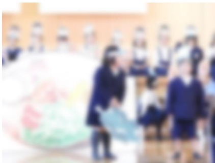
1年生 「サラダでげんき」

子どもたちは緊張しながらも、参観者に見守られながら各学年の発達段階にあった内容を生き生きと発表することができました。どの学年も写真や絵を見せたり、劇を交えたりなどして分かりやすく伝える方法を工夫していました。本年度の学習発表会は、コロナ禍の中でいろんなことに気をつけながら行ってきました。本番までの練習等大変だったと思いますが、この学習発表会を通して、子どもたちは「みんなで協力することや心をつなげて表現することの大切さ」や、「より高いめあてに向かって諦めずに最後まで取り組むことの大切さ」を感じることができたと思います。素晴らしい発表を見せてくれたので、とても嬉しく思いました。